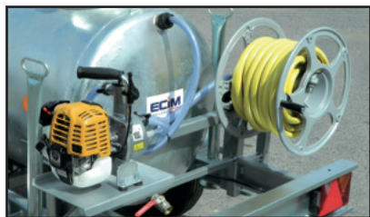
Option kit arrosage